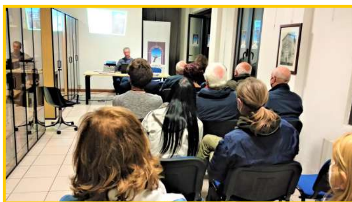
L’attento pubblico presente in sala